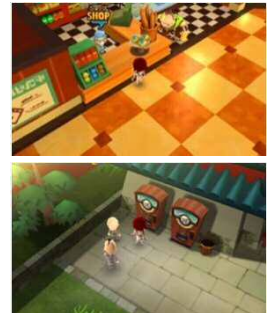
アイテムは「ヨツコシデパート」や 自動販売機で販売予定!!

また、実物の「トンボシャンメリー シルバー」「ラムネ」の開栓音を、『スナックワールド トレジャラーズ』内に収録致しました。ぜひゲーム内で新アイテム「トンボシャンメリー シルバー」「ラムネ」を使用し、本物の「ポン！」という開栓音をお楽しみ下さい。